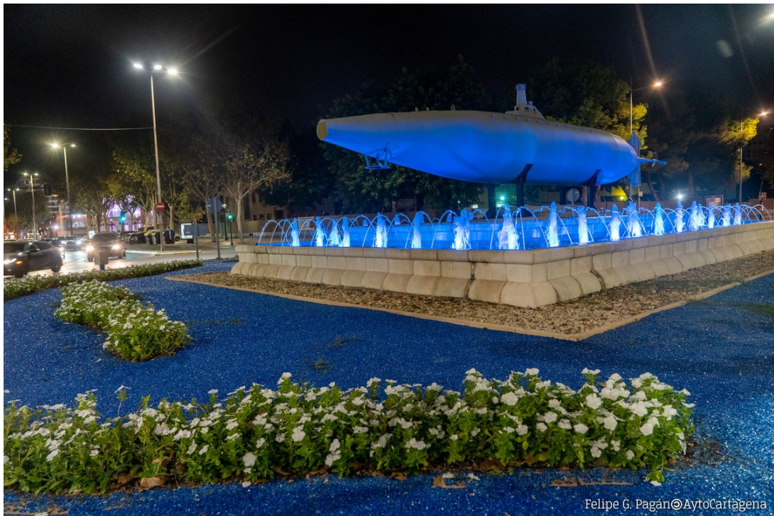
Figure 1. Réplica del Prototipo del Submarino Isaac Peral, construido en Cartagena el 7 de octubre de 1887.