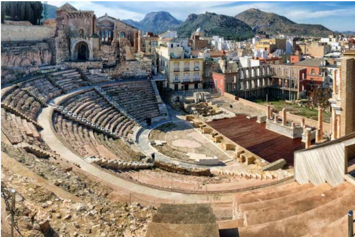
Figure 2. Teatro Romano de Cartagena, construido entre los años 5 y 1 a. C. en la ciudad de Carthago Nova, actual Cartagena.