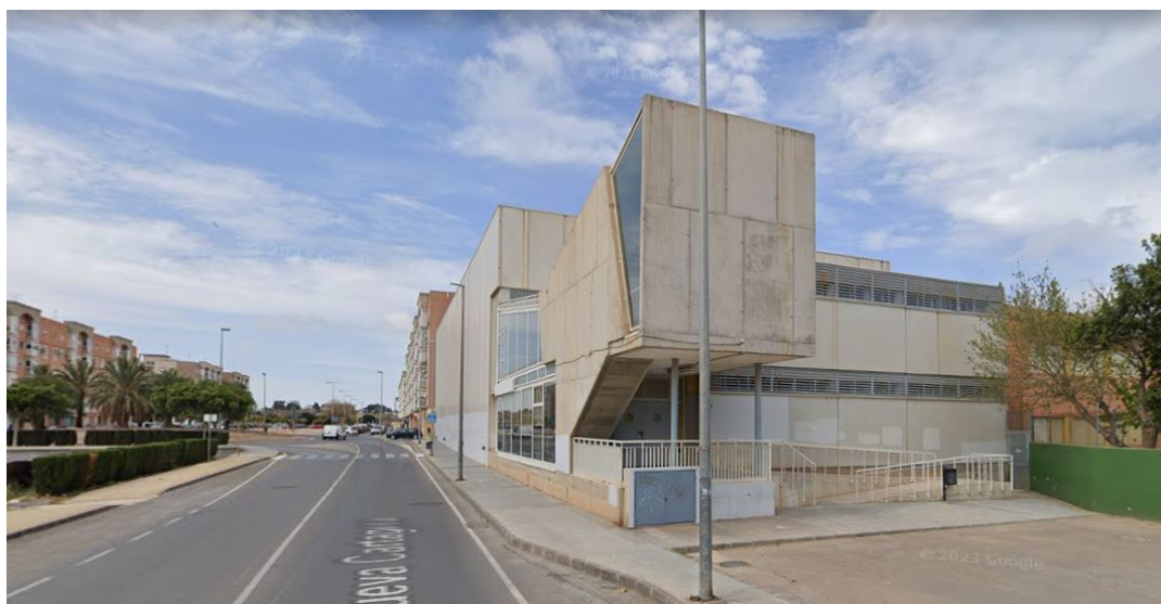
Pabellón Municipal de San Antón (Cartagena)

Ubicación de la Instalación de Competición y de la secretaria técnica.